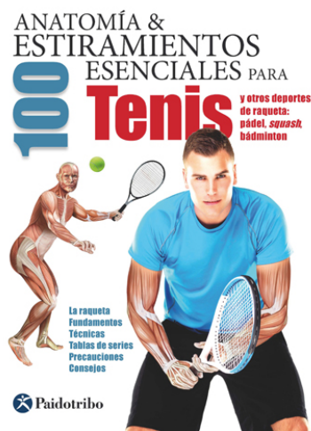
Anatomy & 100 Stretching Exercises for Tennis and other: paddle tennis, squash, badminton