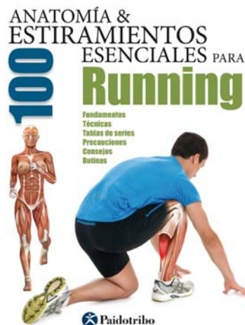
Anatomy & 100 Stretching Exercises for Running