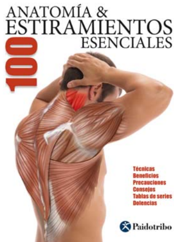
Anatomy & 100 Essential Stretching Exercises